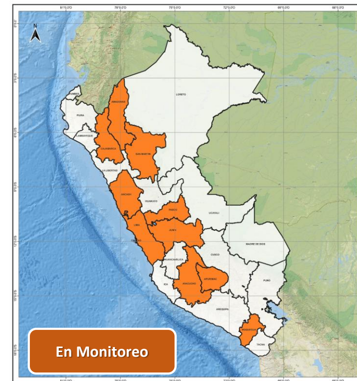
DECRETO SUPREMO N° 034-2026-PCM

Decreto Supremo que declara el Estado de Emergencia en varios distritos de algunas provincias de los departamentos de Amazonas, Áncash, Apurímac, Ayacucho, Cajamarca, Junín, Lima, Moquegua, Pasco y San Martín, por peligro inminente ante intensas precipitaciones pluviales