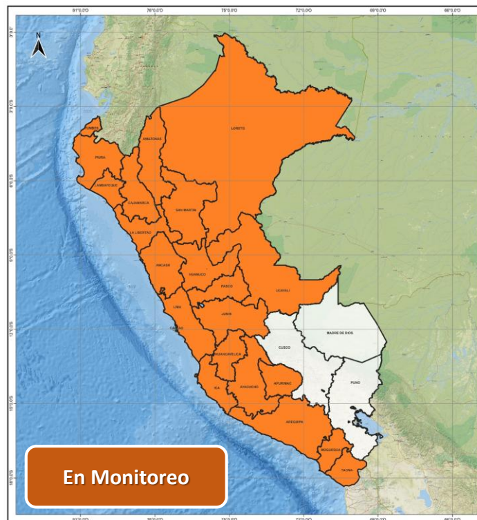
DECRETO SUPREMO N° 048-2026-PCM

Decreto Supremo que prorroga el Estado de Emergencia en varios distritos de algunas provincias de los departamentos de Amazonas, Áncash, Apurímac, Arequipa, Ayacucho, Cajamarca, Huancavelica, Huánuco, Ica, Junín, La Libertad, Lambayeque, Lima, Loreto, Moquegua, Pasco, Piura, San Martín, Tacna, Tumbes y Ucayali, por peligro inminente ante intensas precipitaciones pluviales.