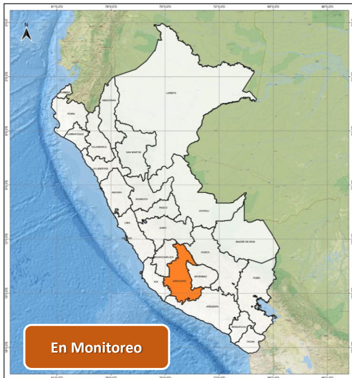
DECRETO SUPREMO N° 031-2026-PCM

Decreto Supremo que declara el Estado de Emergencia en algunos distritos de varias provincias del departamento de Ayacucho, por impacto de daños a consecuencia de intensas precipitaciones pluviales