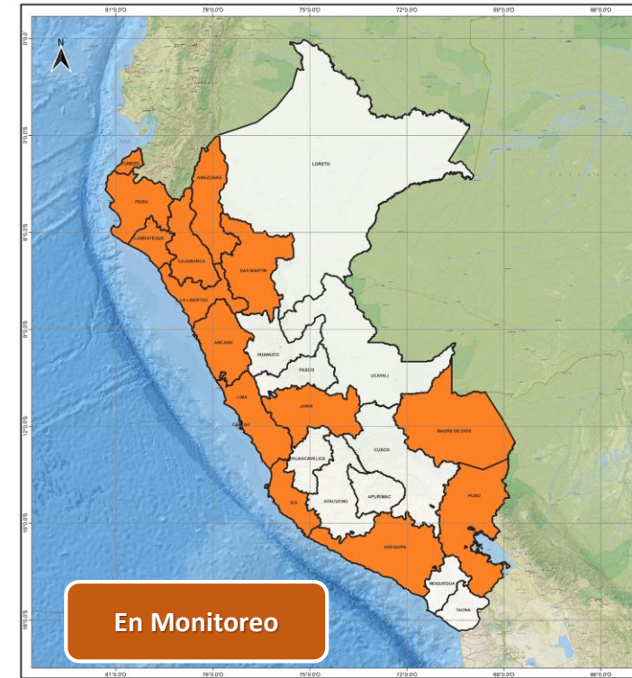
DECRETO SUPREMO N° 059-2026-PCM

Decreto Supremo que prorroga el Estado de Emergencia en varios distritos de algunas provincias de los departamentos de Amazonas, Áncash, Arequipa, Cajamarca, Ica, Junín, La Libertad, Lambayeque, Lima, Madre de Dios, Piura, Puno, San Martín y Tumbes, por peligro inminente ante intensas precipitaciones pluviales.