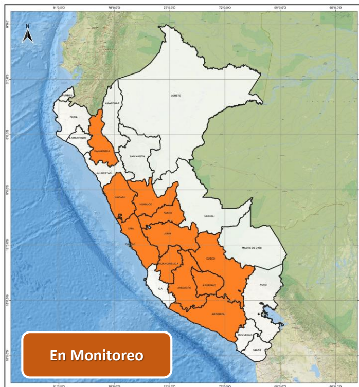
DECRETO SUPREMO N° 047-2026-PCM

Decreto Supremo que declara el Estado de Emergencia en varios distritos de algunas provincias de los departamentos de Áncash, Apurímac, Arequipa, Ayacucho, Cajamarca, Cusco, Huancavelica, Huánuco, Junín, Lima y Pasco, por impacto de daños a consecuencia de intensas precipitaciones pluviales.