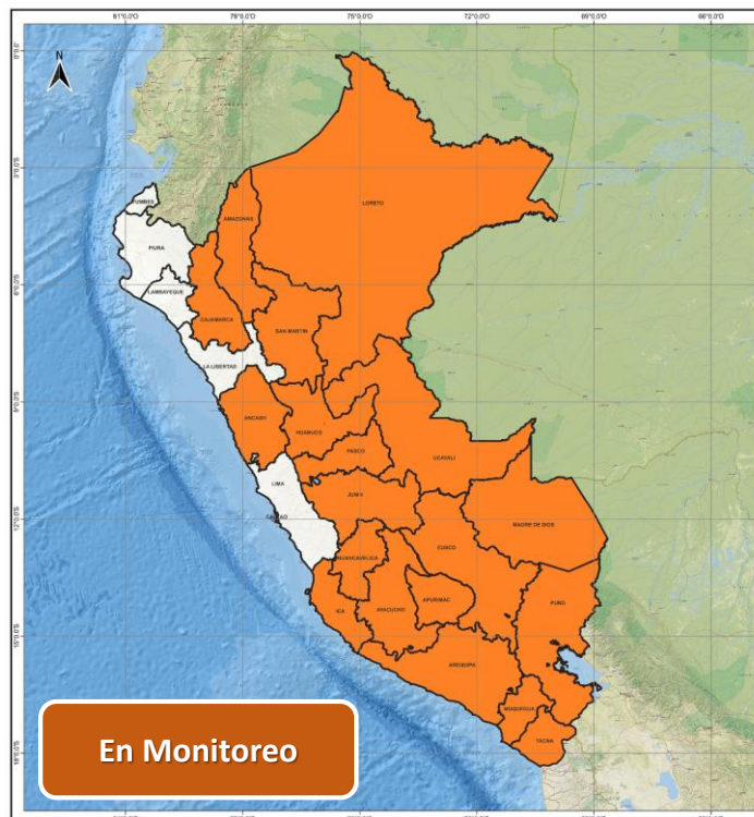
DECRETO SUPREMO N° 032-2026-PCM

Decreto Supremo que prorroga el Estado de Emergencia en algunos distritos de varias provincias de los departamentos de Amazonas, Áncash, Apurímac, Arequipa, Ayacucho, Cajamarca, Cusco, Huancavelica, Huánuco, Ica, Junín, Loreto, Madre de Dios, Moquegua, Pasco, Puno, San Martín, Tacna y Ucayali, por peligro inminente ante intensas precipitaciones pluviales.