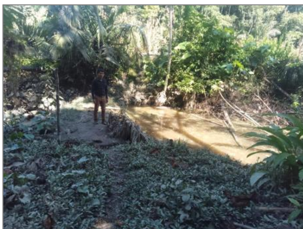
Piscigranja afectada en CC.NN. Isla Grande