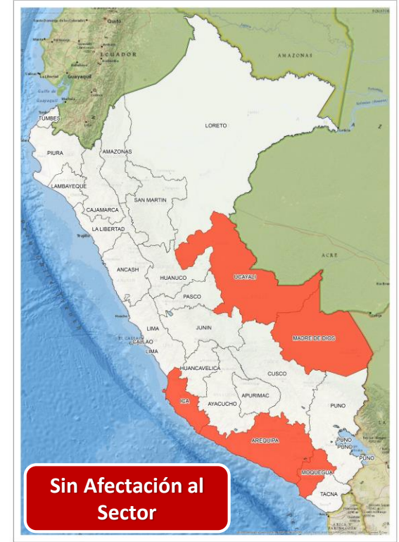
DECRETO SUPREMO N° 021-2024-PCM

Que declara el Estado de Emergencia en varios distritos de algunas provincias de los departamentos de Arequipa, Ica, Madre de Dios, Moquegua y Ucayali por impacto de daños a consecuencia de intensas precipitaciones pluviales.