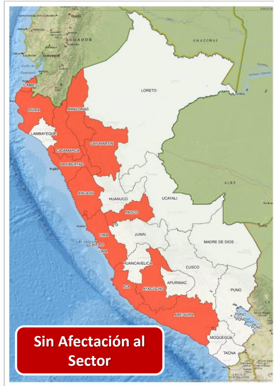
DECRETO SUPREMO N° 038-2024-PCM

Que proroga el Estado de Emergencia en varios distritos de algunas provincias de los departamentos de Amazonas, Ancash, Arequipa, Ayacucho, Cajamarca, Ica, La Libertad, Lmabayeque, Lima, Pasco, Piura, San Martín y Tumbes ,por impacto de daños a consecuencia de intensas precipitaciones pluviales.