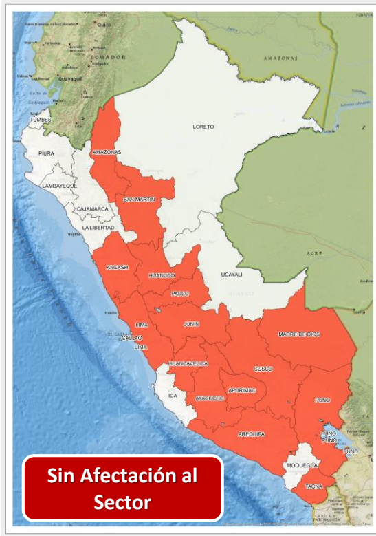
DECRETO SUPREMO N° 039-2024-PCM

Que proroga el Estado de Emergencia en varios distritos de algunas provincias de los departamentos de Amazonas, Ancash, Apurímac, Arequipa, Ayacucho, Cusco, Huancavelica, Huánuco, Junín, Lima, Madre de Dios, Pasco, Puno, San Martín y Tacna, por impacto de daños a consecuencia de intensas precipitaciones pluviales.