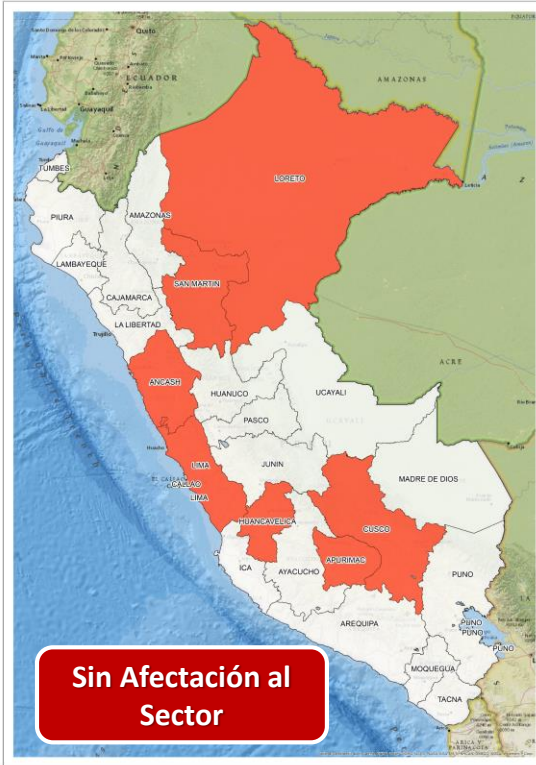
DECRETO SUPREMO N° 032-2024-PCM

Que declara el Estado de Emergencia en varios distritos de algunas provincias de los departamentos de Áncash, Apurímac, Cusco, Huancavelica, Lima, Loreto y San Martín, por impacto de daños a consecuencia de intensas precipitaciones pluviales.