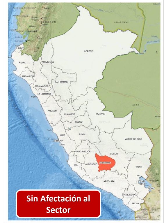
DECRETO SUPREMO N° 030-2024-PCM

Que declara el Estado de Emergencia en varios distritos de algunas provincias de los departamentos de Amazonas, Áncash, Apurímac, Arequipa, Ayacucho, Cajamarca, Cusco, Huancavelica, Huánuco, Ica, Junín, Lima, Madre de Dios, Puno, Tacna y Ucayali, por impacto de daños a consecuencia de intensas precipitaciones pluviales.