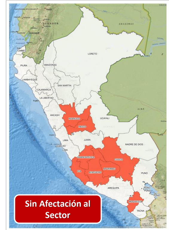
DECRETO SUPREMO N° 033-2024-PCM

Que proroga el Estado de Emergencia en varios distritos de algunas provincias de los departamentos de Arequipa, Ayacucho, Cusco, Huánuco, Huancavelica, Ica, Moquegua y Pasco, por impacto de daños a consecuencia de intensas precipitaciones pluviales.