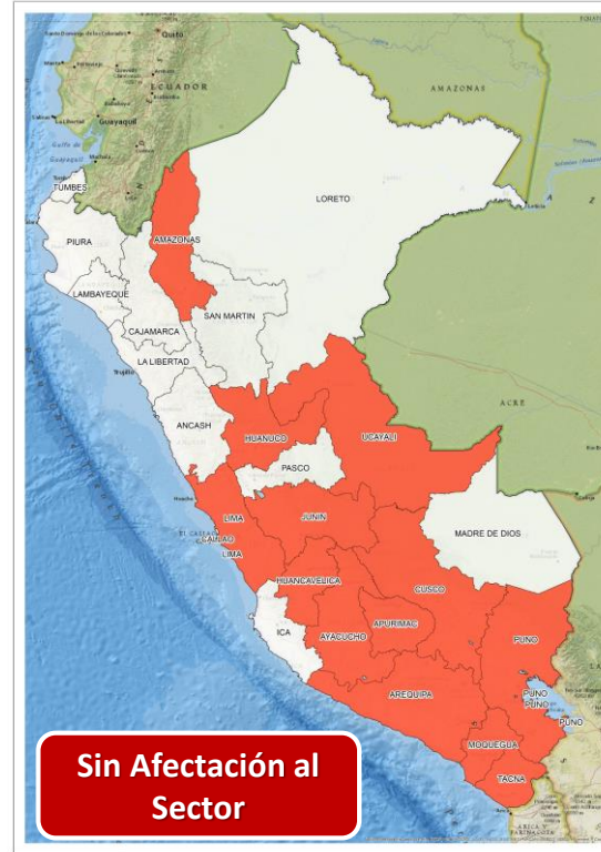
DECRETO SUPREMO N° 026-2024-PCM

Que declara el Estado de Emergencia en varios distritos de algunas provincias de los departamentos de Amazonas, Apurímac, Arequipa, Ayacucho, Cusco, Huancavelica, Huánuco, Junín, Lima, Moquegua, Puno, Tacna y Ucayali por impacto de daños a consecuencia de intensas precipitaciones pluviales.