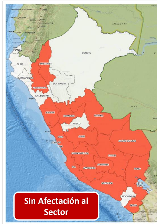
DECRETO SUPREMO N° 031-2024-PCM

Que declara el Estado de Emergencia en varios distritos de algunas provincias de los departamentos de Áncash, Apurímac, Cusco, Huancavelica, Lima, Loreto y San Martín, por impacto de daños a consecuencia de intensas precipitaciones pluviales.