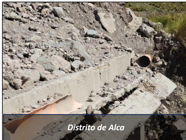
Distrito de Alca