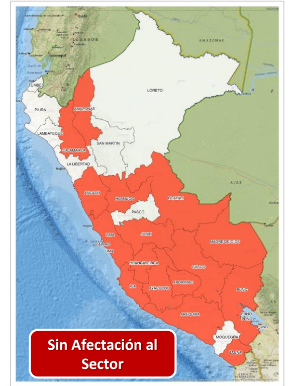
DECRETO SUPREMO N° 031-2024-PCM

Que declara el Estado de Emergencia en varios distritos de algunas provincias de los departamentos de Áncash, Apurímac, Cusco, Huancavelica, Lima, Loreto y San Martín, por impacto de daños a consecuencia de intensas precipitaciones pluviales.