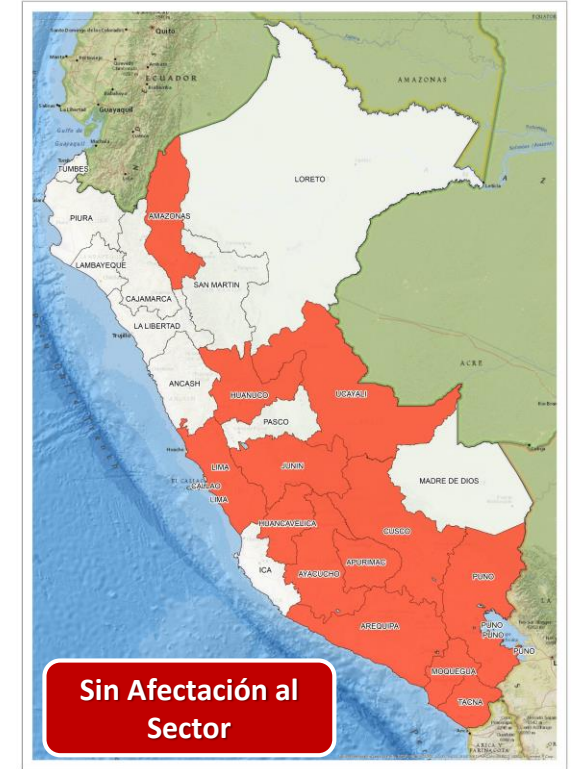
DECRETO SUPREMO N° 026-2024-PCM

Que declara el Estado de Emergencia en varios distritos de algunas provincias de los departamentos de Amazonas, Apurímac, Arequipa, Ayacucho, Cusco, Huancavelica, Huánuco, Junín, Lima, Moquegua, Puno, Tacna y Ucayali por impacto de daños a consecuencia de intensas precipitaciones pluviales.