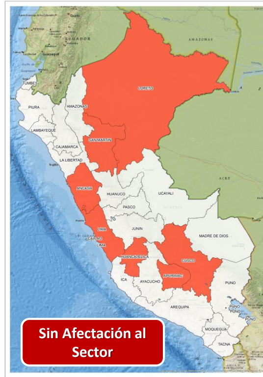
DECRETO SUPREMO N° 032-2024-PCM

Que prorroga el Estado de Emergencia en varios distritos de algunas provincias de los departamentos de Arequipa, Ayacucho, Cusco, Huánuco, Huancavelica, Ica, Moquegua y Pasco, por impacto de daños a consecuencia de intensas precipitaciones pluviales.