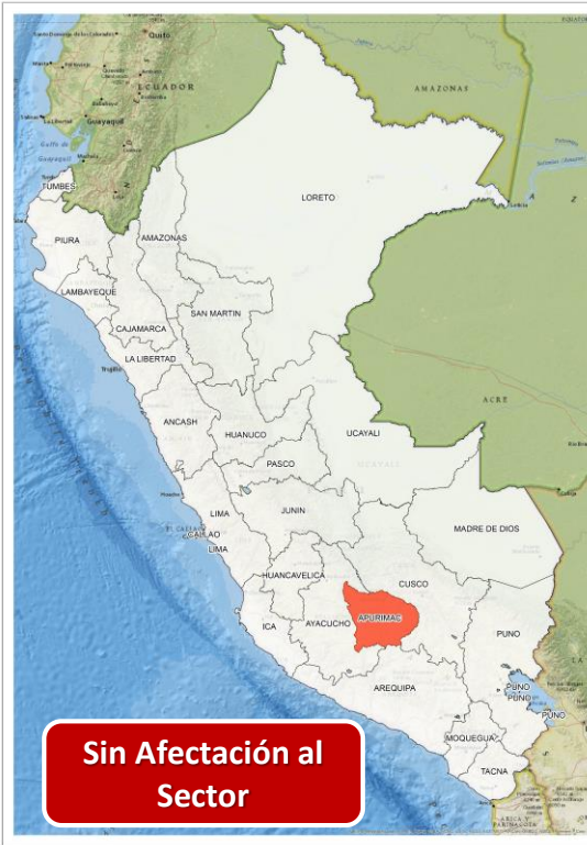
DECRETO SUPREMO N° 030-2024-PCM

Que declara el Estado de Emergencia en el distrito de Chahuanca de la provincia de Aymaraes del departamento de Apurímac por impacto de daños a consecuencia de intensas precipitaciones pluviales.