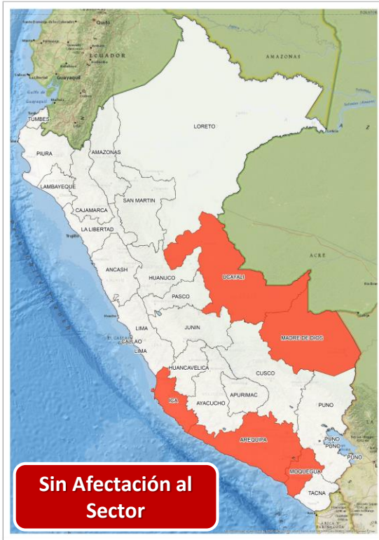
DECRETO SUPREMO N° 021-2024-PCM

Que declara el Estado de Emergencia en varios distritos de algunas provincias de los departamentos de Arequipa, Ica, Madre de Dios, Moquegua y Ucayali por impacto de daños a consecuencia de intensas precipitaciones pluviales.