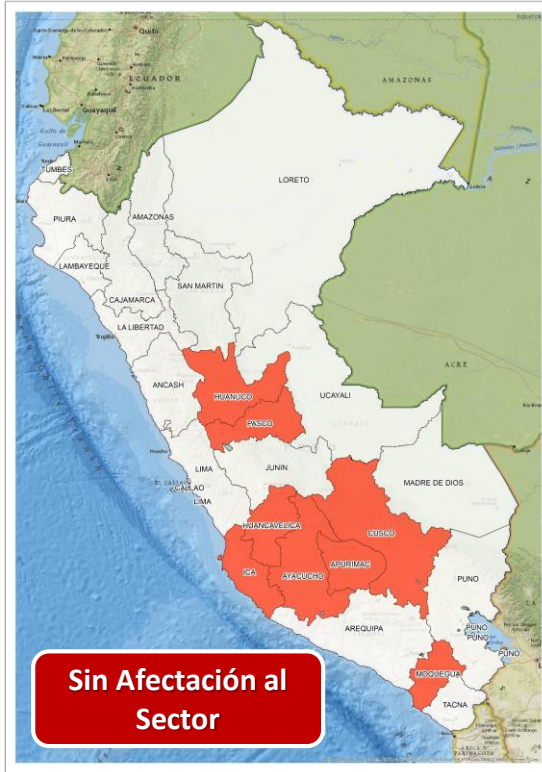
DECRETO SUPREMO N° 033-2024-PCM

Que prorroga el Estado de Emergencia en varios distritos de algunas provincias de los departamentos de Arequipa, Ayacucho, Cusco, Huánuco, Huancavelica, Ica, Moquegua y Pasco, por impacto de daños a consecuencia de intensas precipitaciones pluviales.