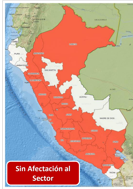
DECRETO SUPREMO N° 020-2024-PCM

Que declara el Estado de Emergencia en varios distritos de algunas provincias de los departamentos de Arequipa, Ica, Madre de Dios, Moquegua y Ucayali por impacto de daños a consecuencia de intensas precipitaciones pluviales.