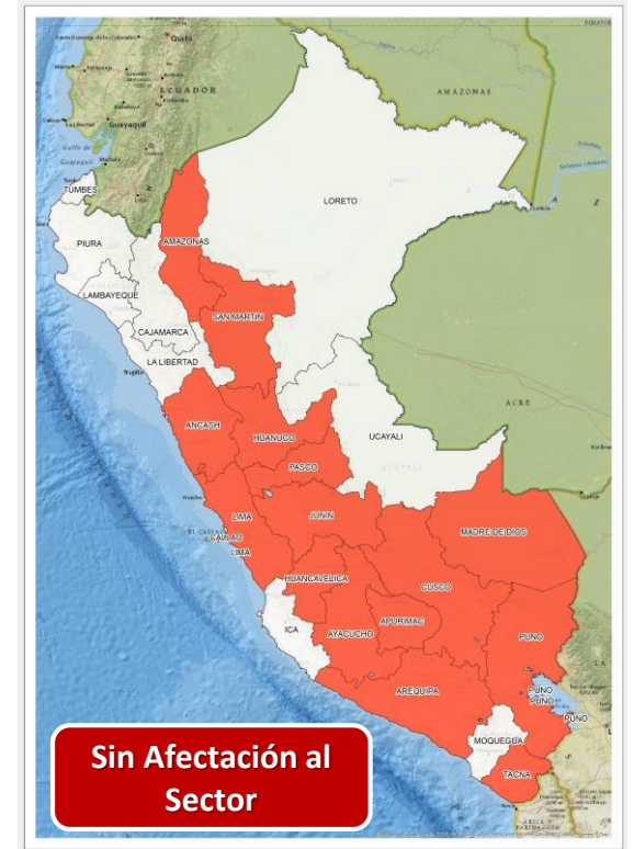
DECRETO SUPREMO N° 016-2024-PCM

Que declara el Estado de Emergencia en varios distritos de algunas provincias de los departamentos de Amazonas, Ancash, Apurímac, Arequipa, Ayacucho, Cajamarca, Cusco, Huancavelica, Huánuco, Ica, Junín, La Libertad, Lima, Loreto, Moquegua, Pasco y Puno por impacto de daños a consecuencia de intensas precipitaciones pluviales.